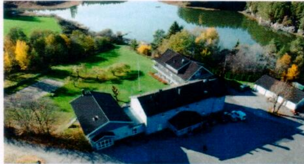
Bildet: Stenbekk kurs- og konferansesenter

sin «Mission Back» gruppe og lokale krefter i Rogaland. Her blir det besøk ved flere videregående skoler, flere møter og en gudstjeneste. Programmet for disse dagene vil vi også sende ut i eget nyhetsbrev.