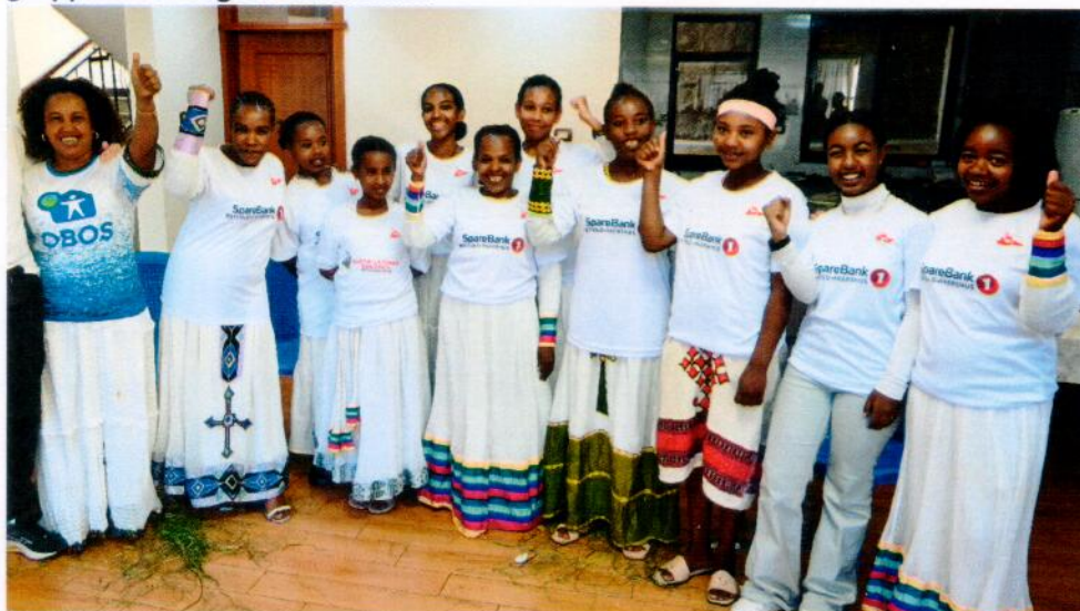
Bildet: Et sterkt møte med jenter, frivillige og ansatte ved Deborah-hjemmet.

Gatebarnprosjektet i regi av Win Souls for God og Bright Star drives utvilsomt av tro, håp og nestekjærlighet. Det er den sterke overbevisningen etter årets gruppereise i regi av Gatefolket.